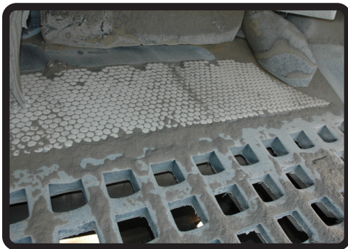
Área de Impacto en las Mallas Clasificadoras de los Harneros

Mientras que el caucho es más resistente a la abrasión que el acero en la aplicación correcta, la cerámica es más resistente a la abrasión que el caucho. Generalmente cerámica sin caucho no es la solución correcta.