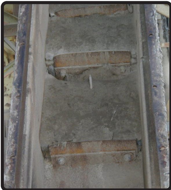
A/R recubrimientos de Acero