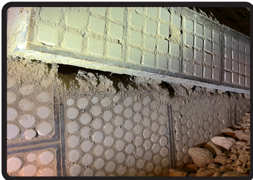
Variedad de geometrías

Esferas Cerámicas pueden resistir grandes impactos debido a su geometría; los sistemas de componentes tradicionales usando cerámica no funcionan. Como una alternativa, caucho es moldeado alrededor y debajo de estas, empacándolas de manera ajustada, así es como se crean los Revestimientos Valley Rubber HardBall para las aplicaciones más severas.