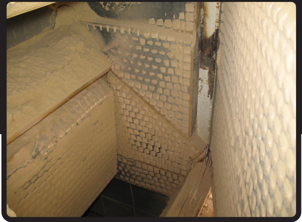
Revestimientos de Cubos Cerámicos aplicada en la Puerta Triple del Alimentador puede soportar condiciones extremas de impacto y abrasión por años.

Mientras que el caucho es más resistente a la abrasión que el acero en la aplicación correcta, la cerámica es más resistente a la abrasión que el caucho. Generalmente cerámica sin caucho no es la solución correcta.