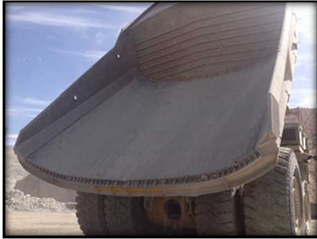
Camión Komatsu 930, 5 años usando recubrimientos de caucho y aun en Servicio

Gracias a que el caucho tiene la propiedad de absorber 400% más fuerza de impacto que el acero, el efecto látigo en el cuerpo del operario del equipo y el ruido en el interior de la cabina fueron reducidos en forma considerable. Todos estos beneficios generaron más horas productivas.