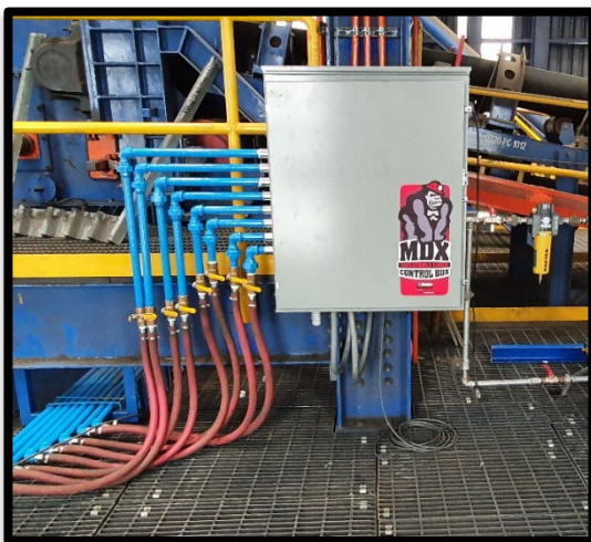
Caja de Control MDX de Valley Rubber

Al momento de esta publicación, 120,846.72 toneladas de concentrado de cobre han viajado a través del chute revestido por Valley Rubber con inflables, donde el contenido promedio de humedad del material es del 10% pero en ocasiones puede ser superior al 12%. Desde la implementación de nuestro revestimientos inflables, la operación ha pasado los 90 días sin interrupción alguna.