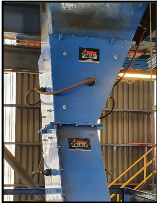
El nuevo Sistema de Valley Rubber

Una operación Latinoamericana estaba experimentando acumulación de material en sus chutes. En cada periodo de trabajo, la producción tendría que detenerse hasta tres veces para desbloquear los chutes y las tolvas de alimentación con martillos y motores vibratorios. Estas paradas no programadas fueron un gran problema. Este proceso no solo requería mucho tiempo, sino que también generaba problemas de salud, seguridad, y medio ambiente.