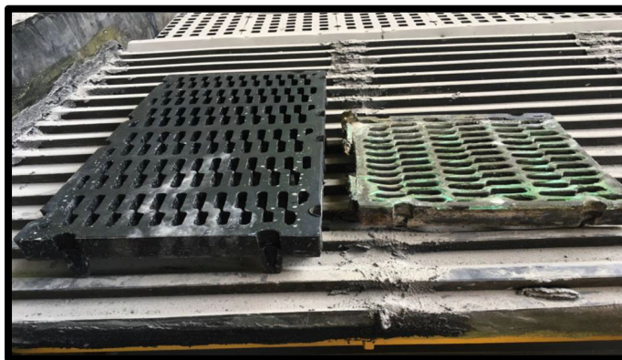
Foto de arriba. (Izquierda) Malla de Valley Rubber (Derecha) Malla utilizada anteriormente